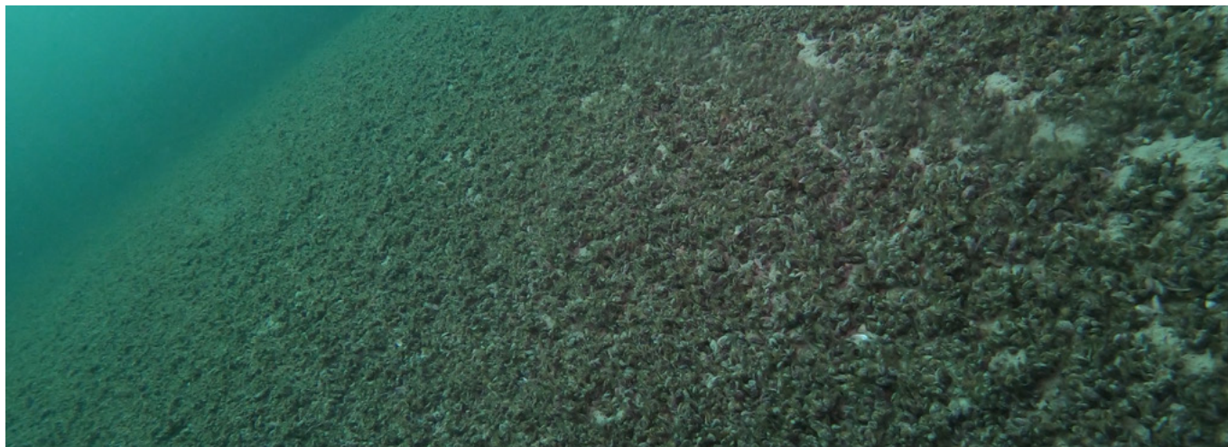
Abb. 2: Quaggamuscheln bedecken fast den kompletten Seeboden in 12 m Wassertiefe in der Nähe von Friedrichshafen.